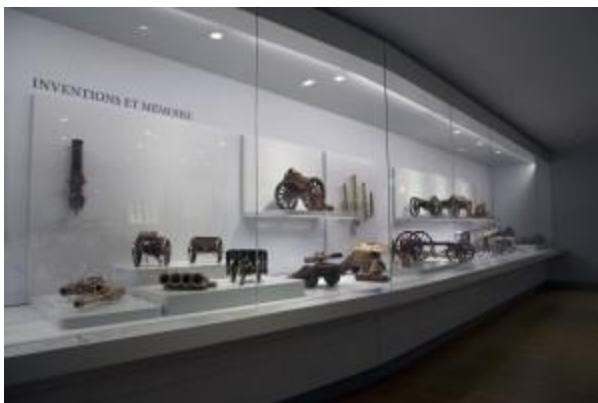
Cabinets insolites – salle des modèles d'artillerie

Ces trois salles sont un vrai point d'émerveillement et de surprise pour les visiteurs du musée.